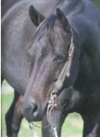
Foto oben: Die dominante Variante des Agouti-Gens (A) führt zu einer braunen Fellfarbe, Mähne und Schweif sind schwarz.

Liegt das rezessive Allel homozygot (Genotyp a/a) vor, entsteht ein Rappe.